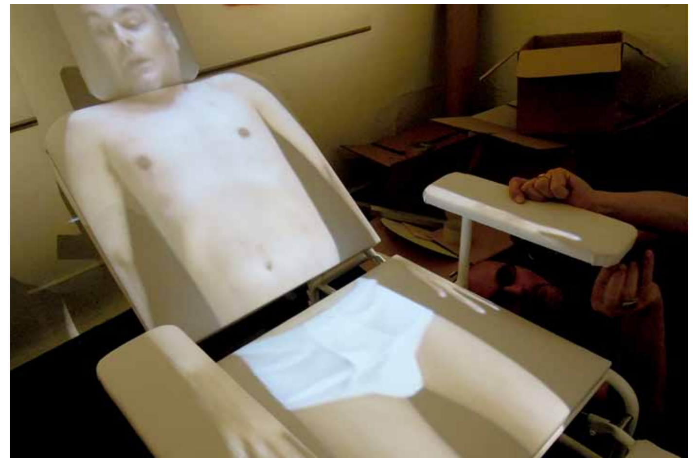
Titel: o.T. aus der Serie „beaute“, Teil des Projekts homo modernus, Ansichten aus Ausstellung masc foundation/39 dada